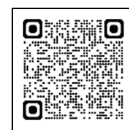
公立高校入試 出願・実施状況等